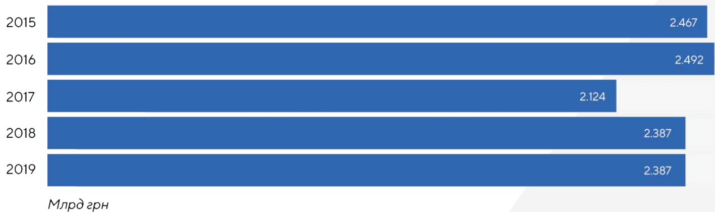
Рисунок 1: Загальна потреба в коштах ПАТ “НСТУ” зазначена у бюджетних запитах, 2015–2019 роки