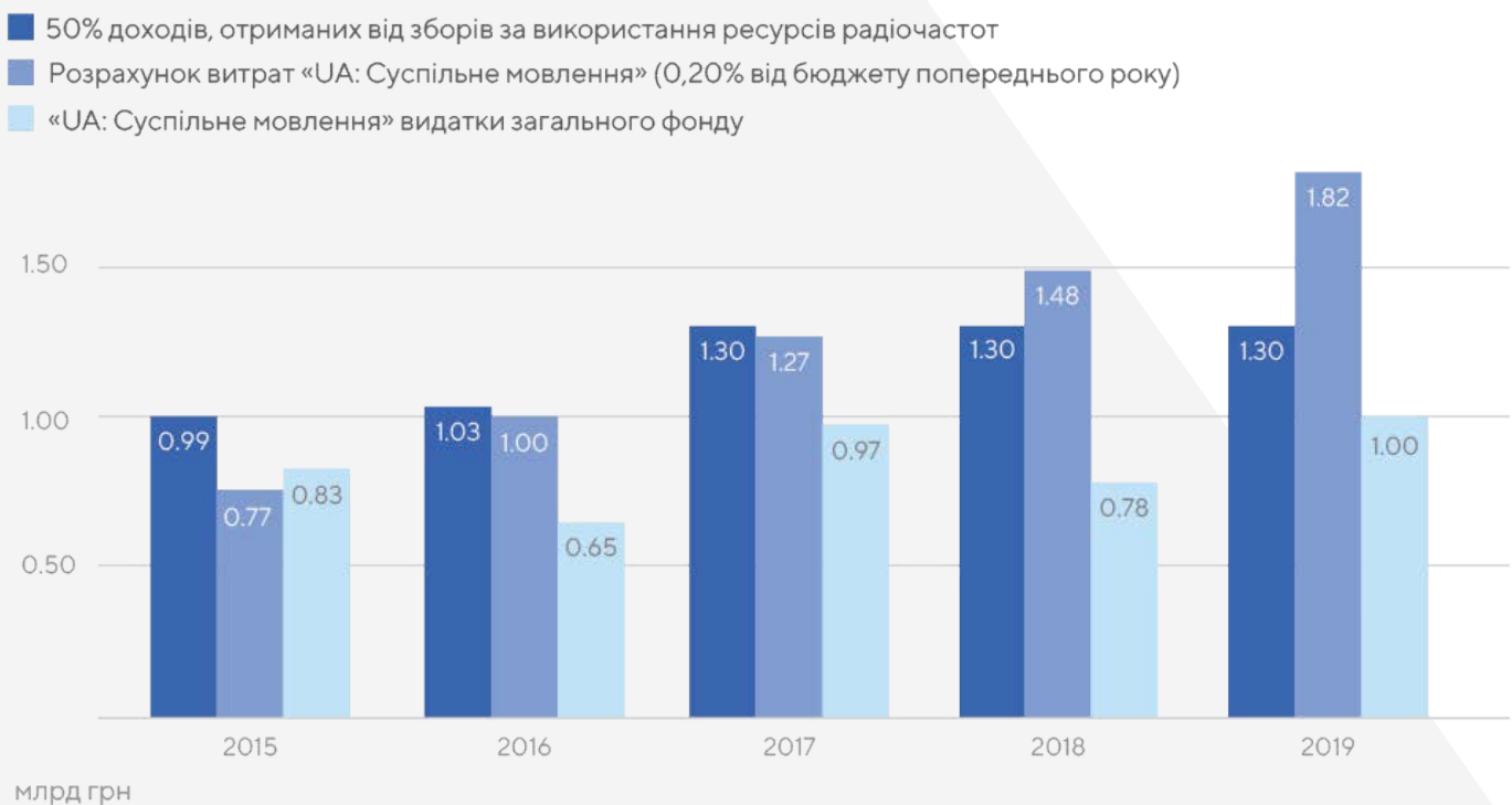
Рисунок 2: Фінансування «UA: Суспільне мовлення»: поточне та нове, реальні та прогнозовані видатки на 2015–2019 роки

Наведена нижче діаграма порівнює вплив поточного фінансування, модель, встановлену законом, і прогнозовані доходи запропонованої моделі фінансування.